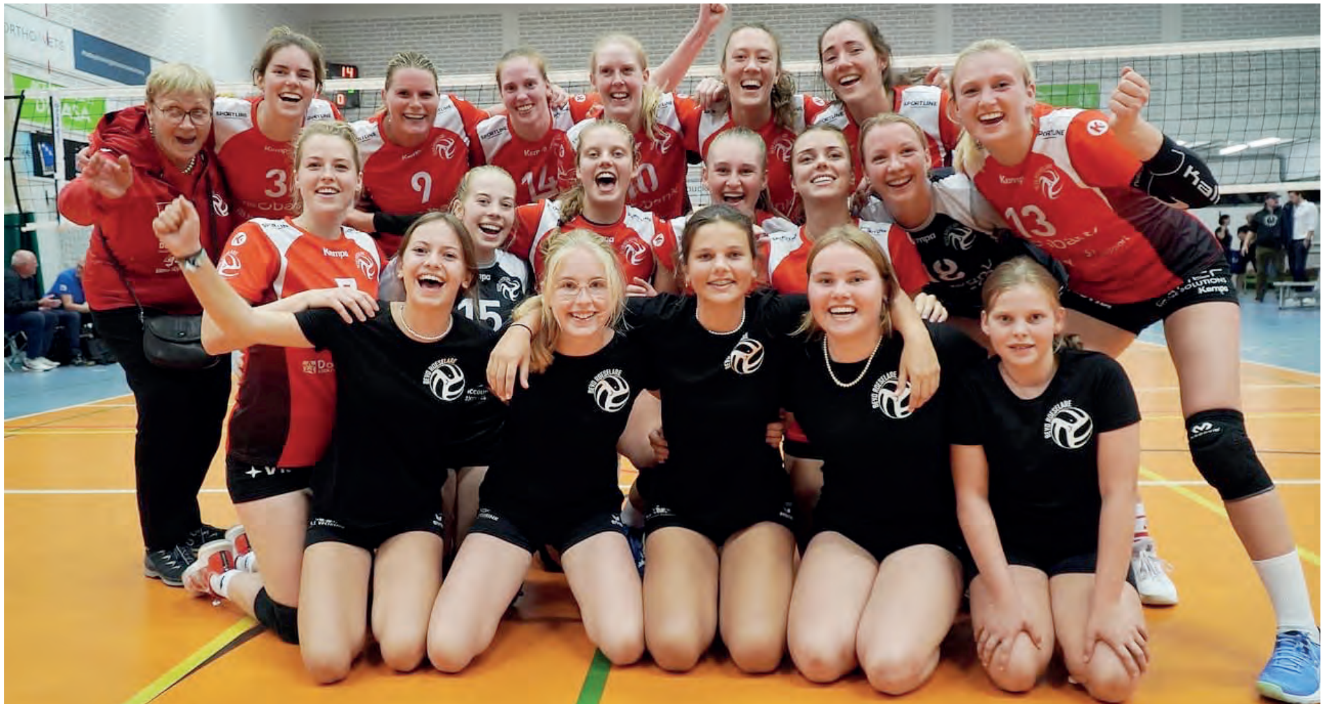
De U15 ploeg (vooraan) die vorig jaar kampioen werd.