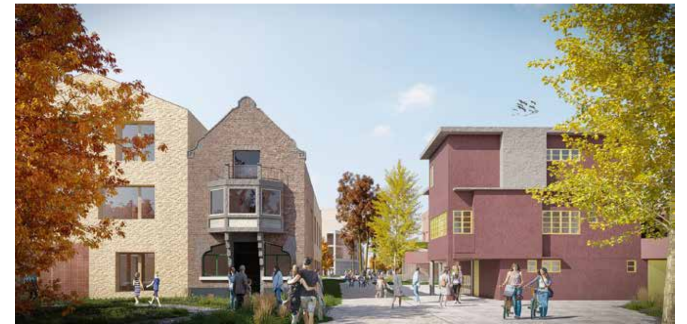
Eerste visie op school, bibliotheek en O.L.V.-Markt