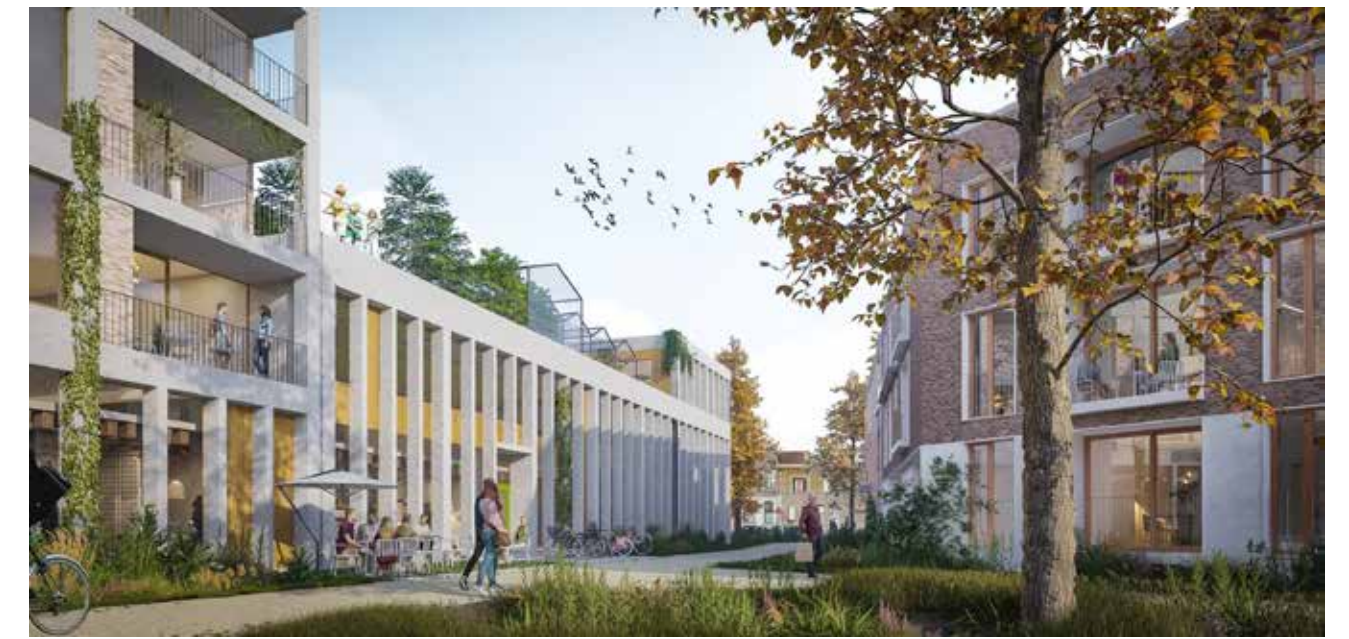
Eerste visie op groen binnengebied

Wil je er in de toekomst ook graag bij zijn? Schrijf je dan in via caaap.be/dammancroes/participatie .